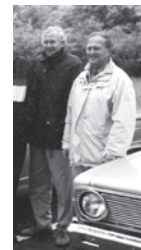
De jonge generatie